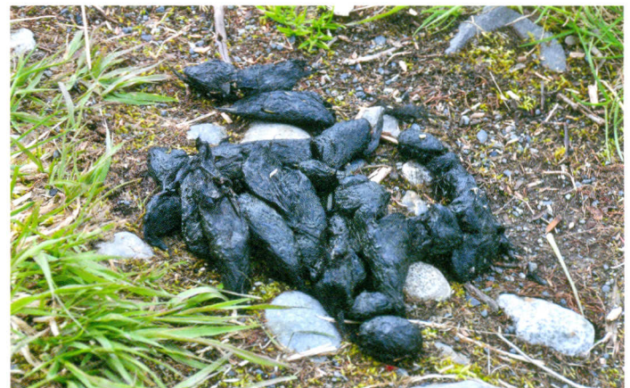
Verse 'bearpoop' geeft aan dat hier net beren hebben gelopen.