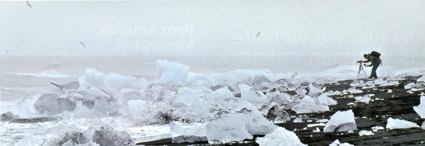
Breidamerkursandur: brokken gletsjerijs vinden hier hun weg naar de oceaan. Tijdens vloed worden de ijsbrokken op het zwarte lavastrand teruggeworpen.