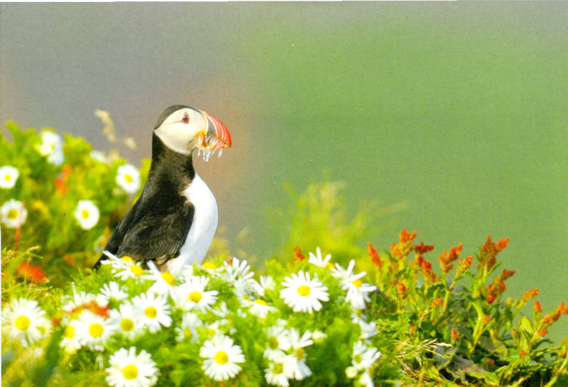
Papegaaiduiker bij Dyrhólaey